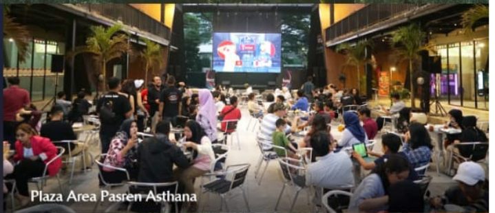
Plaza Area Pasren Asthana