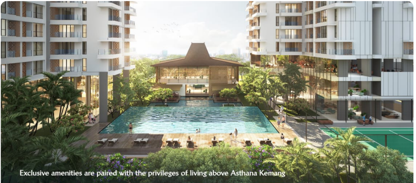
Exclusive amenities are paired with the privileges of living above Asthana Kemang