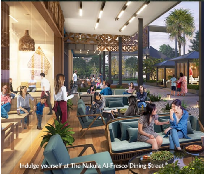
Indulge yourself at The Nakula AI-Fresco Dining Street