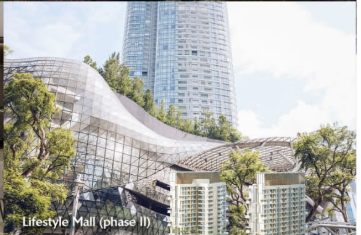
Lifestyle Mall (phase II)