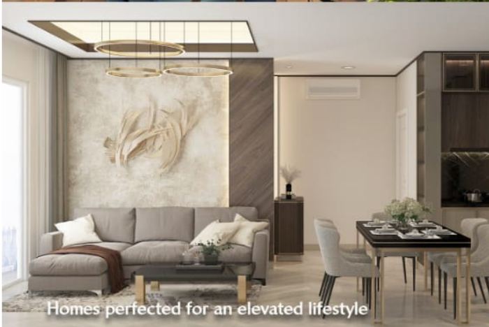
Homes perfected for an elevated lifestyle