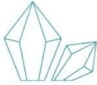
Tomang Beryl Residence