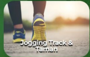
Jogging Track & Taman