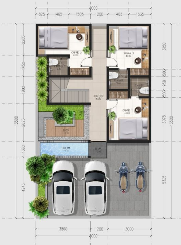
DENAH LT. DASAR