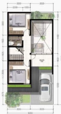
DENAH LT. ATAS