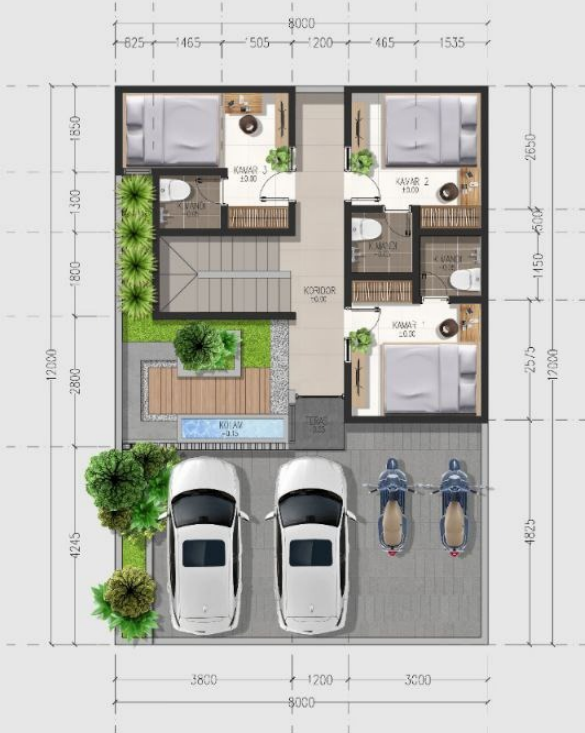
DENAH LT. DASAR