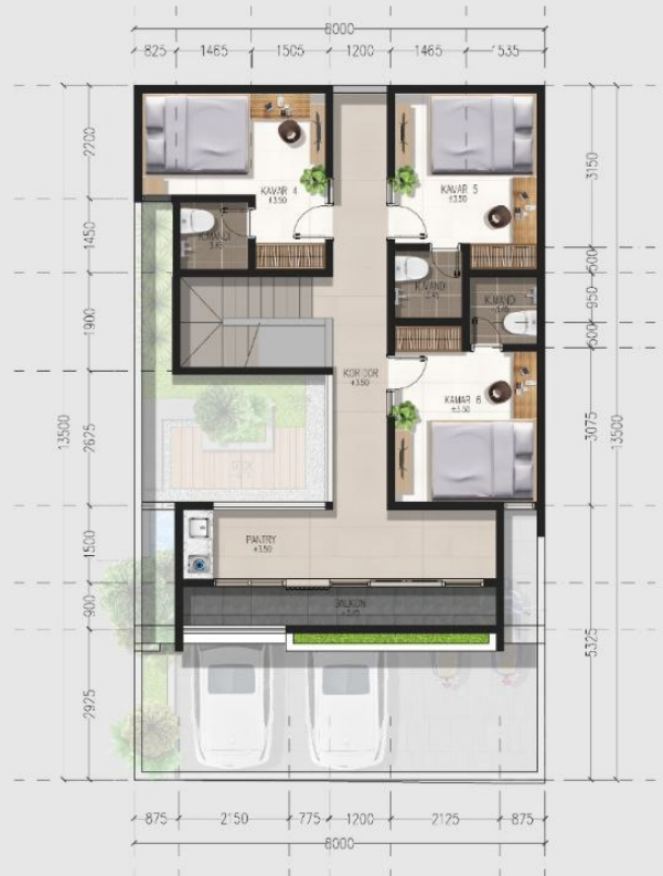
DENAH LT. ATAS