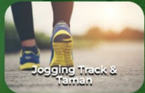
Jogging Track & Taman