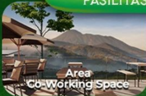
Area Co-Working Space