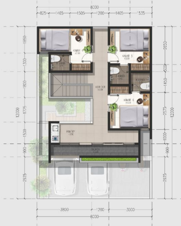
DENAH LT. ATAS