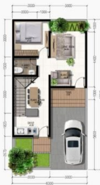
DENAH LT. DASAR