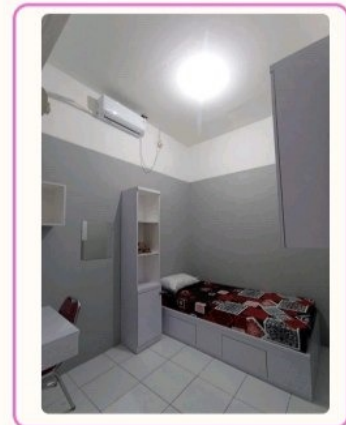
TIPE STANDARD 3 meter x 2,5 meter