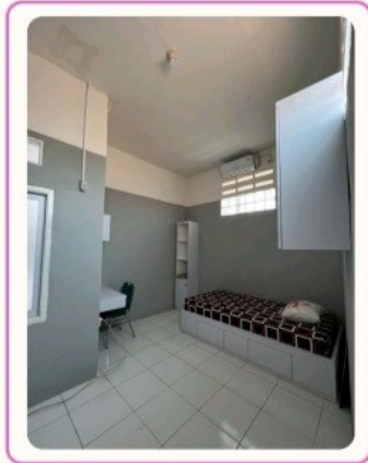
TIPE L (PALING LUAS) 5 meter x 3,1 meter