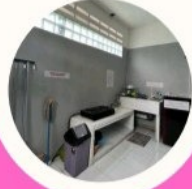
Akses Tangga Dalam + Dapur