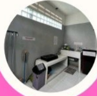
Akses Tangga Dalam + Dapur