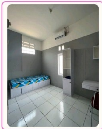
TIPE SEDANG 4,8 meter x 2,8 meter