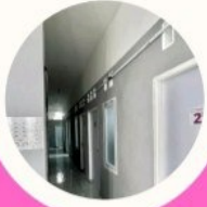
Jalan Akses Kamar

D'Jasmine House ini memiliki 19 kamar di setiap lantainya, 7 kamar mandi luar di setiap lantai, serta dapur lengkap di setiap lantai.