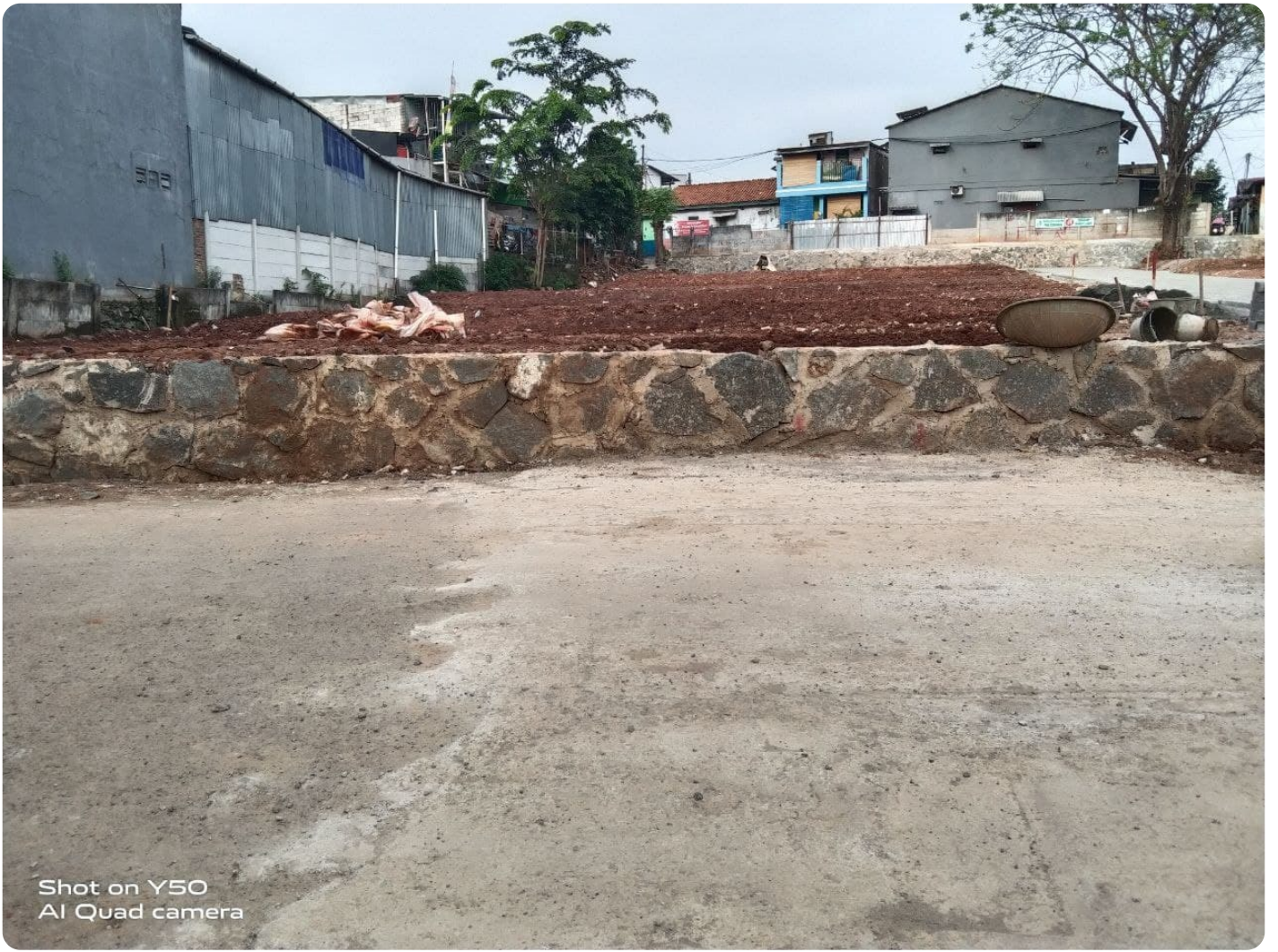
Shot on Y50 AI Quad camera