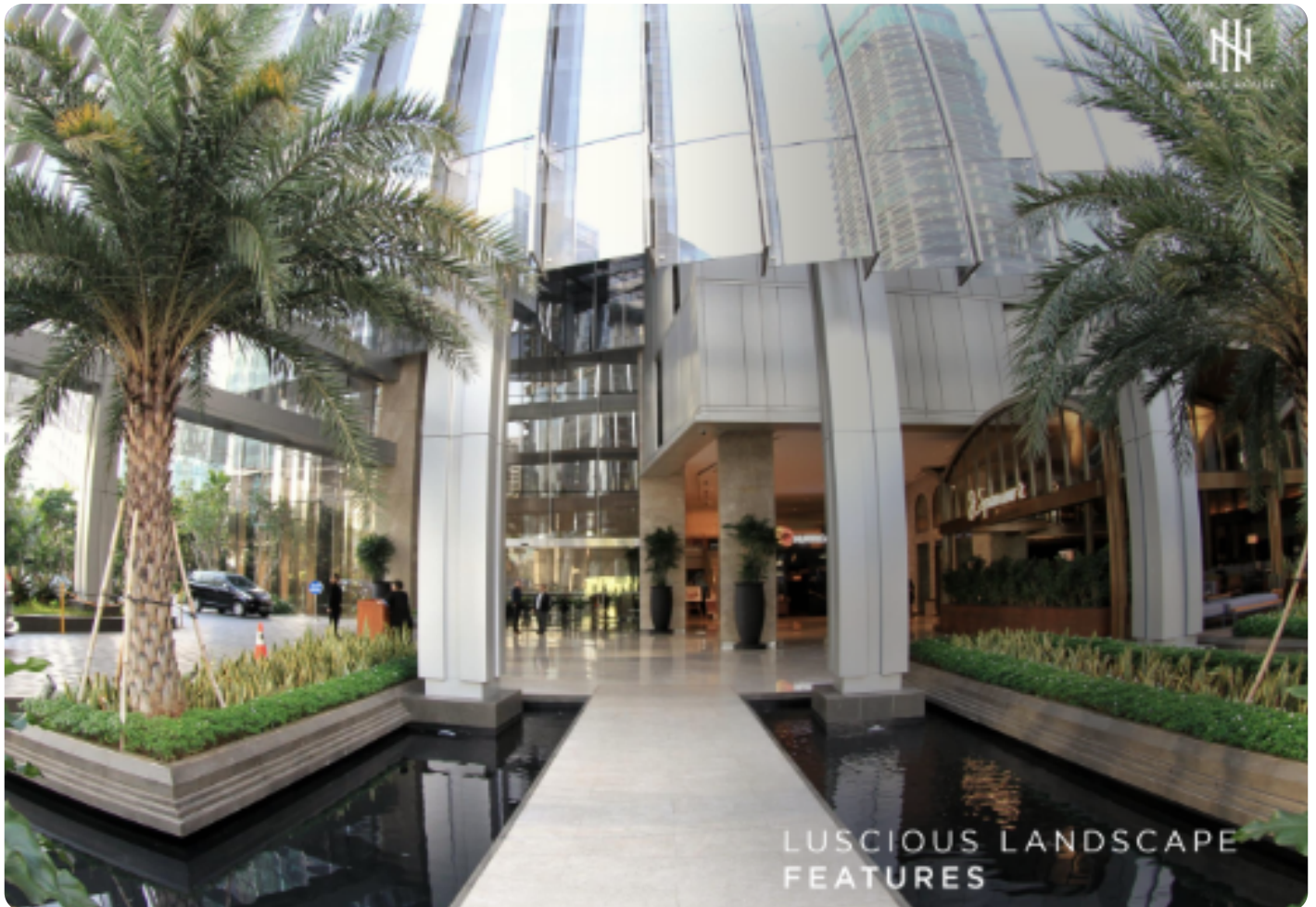
LUSCIOUS LANDSCAPE FEATURES