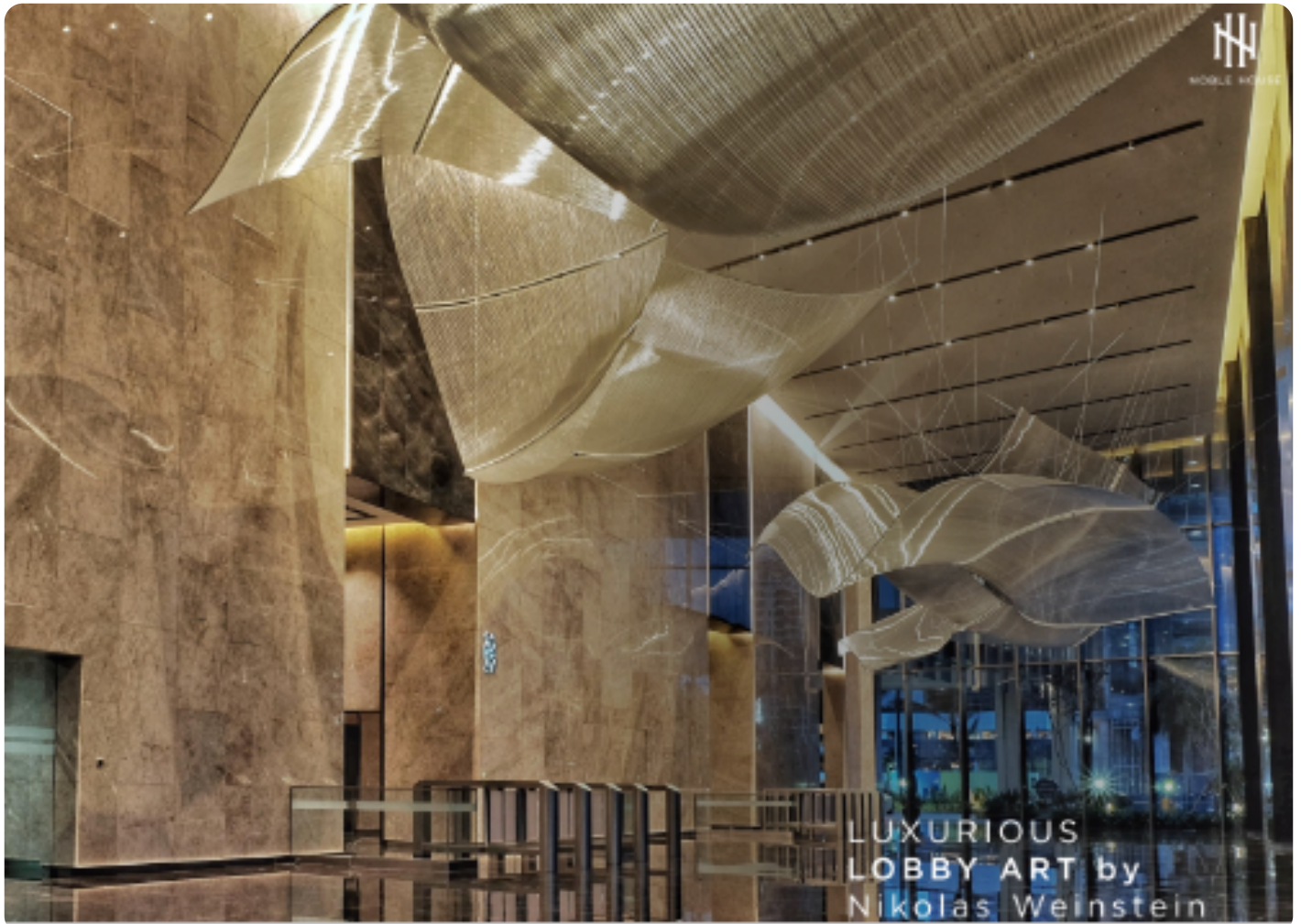
LUXURIOUS LOBBY ART by Nikolas Weinstein